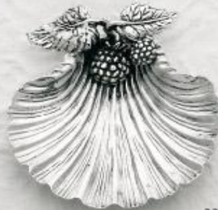
3319 Gr. 14,5