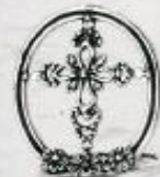
3268 Gr. 5,2