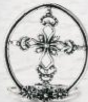
3267 Gr. 6,7