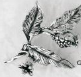
3534 Gr. 17,7