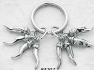
P3207 Gr. 21,0