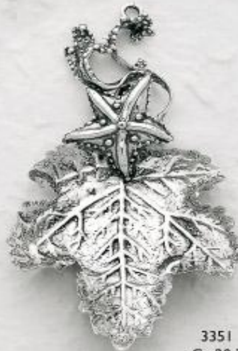
3351 Gr. 20,3