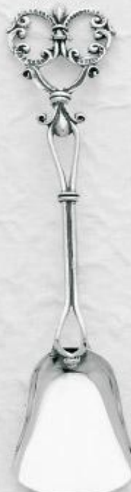
3149 Gr. 14,4