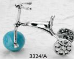
3324/A Gr. 10,8