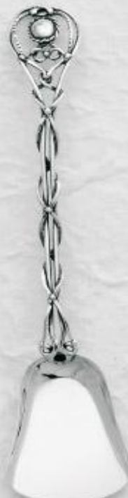
3146 Gr. 12,0