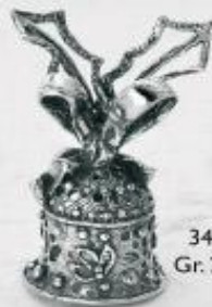
3420 Gr. 21,8