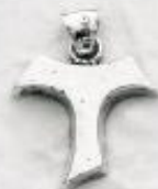
3339/B Gr. 5,7