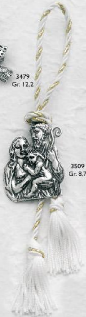
3509 Gr. 8,7