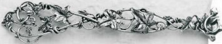
3575 Gr. 35,2