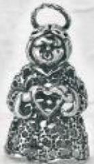
3382 Gr. 12,0