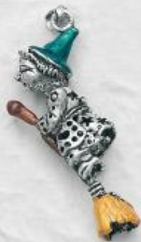
3480/A Gr. 20,0