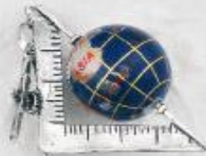
3254 Gr. 12,4