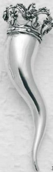
3126 Gr. 36,0