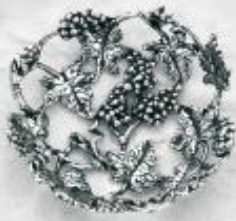
3546 Gr. 10,0