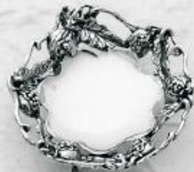
3553 Gr. 14,2