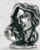
3129/A Gr. 8,0