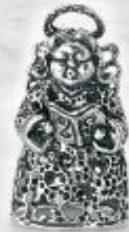
3383 Gr. 13,0