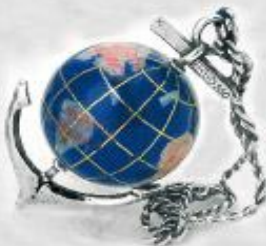
3256 Gr. 22,0