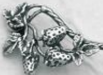
3522 Gr. 26,5