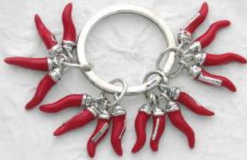
P3163/A Gr. 41,0