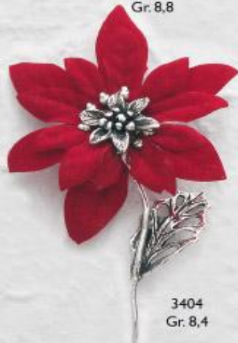
3404 Gr. 8,4