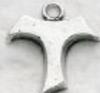
3339/A Gr. 5,3