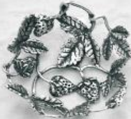
3543 Gr. 11,4