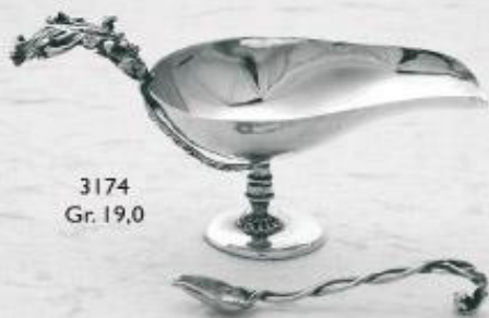
3174 Gr. 19,0