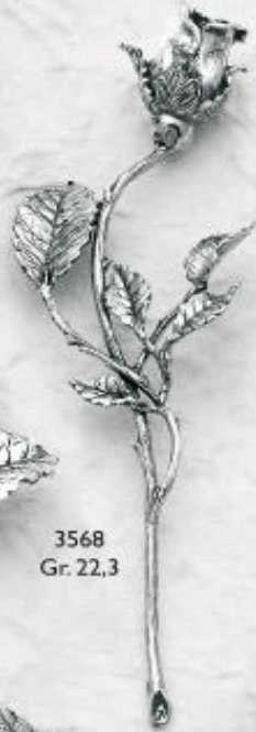
3568 Gr. 22,3