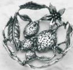
3542 Gr. 12,2