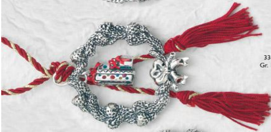
3369 Gr. 13,5