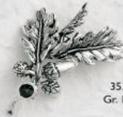
3532 Gr. 13,4