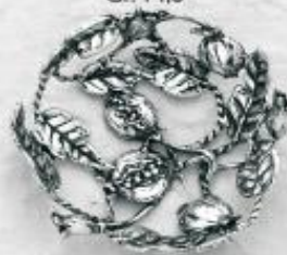
3544 Gr. 12,5