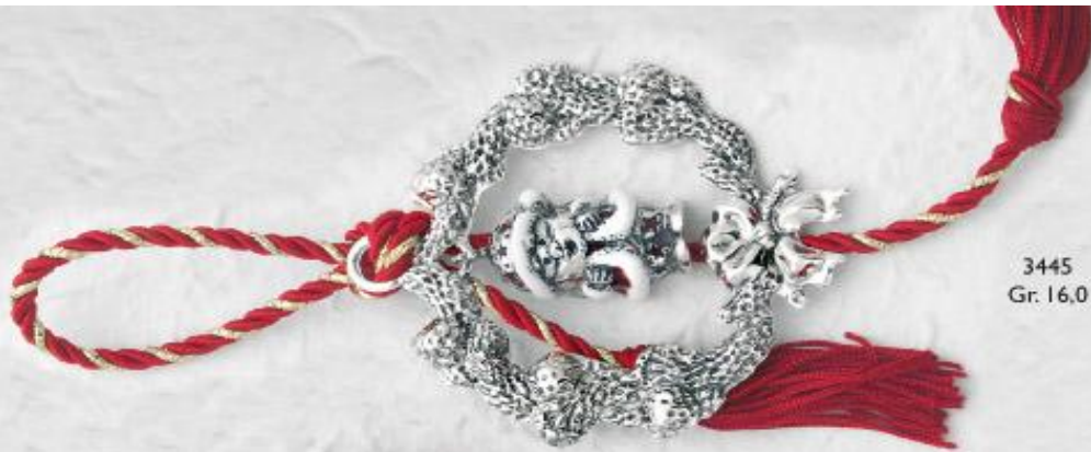
3445 Gr. 16,0