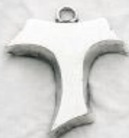
3338/A Gr. 8,5