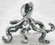
3290 Gr. 15,5