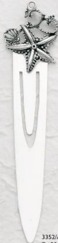
3352/A Gr. 23,0