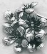
3520 Gr. 31,2