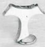
3339 Gr. 5,4