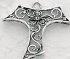
3345/A Gr. 7,7