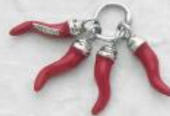
3163 Gr. 8,7