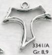
3341/A Gr. 8,9