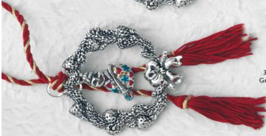
3376 Gr. 13,1