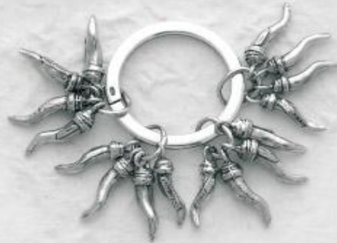
P3163 Gr. 40,0