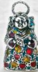
3383/A Gr. 13,3