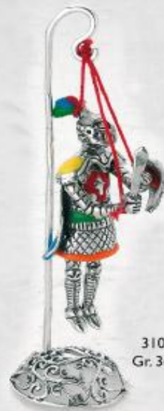
3101 Gr. 36,8