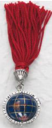
3260 Gr. 15,0