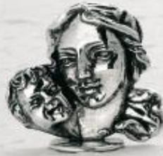
3130/A Gr. 12,0