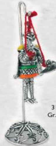
3172 Gr. 23,6