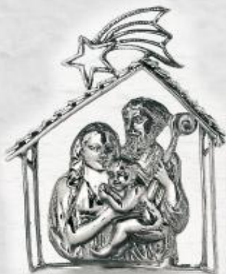
3510 Gr. 19,1