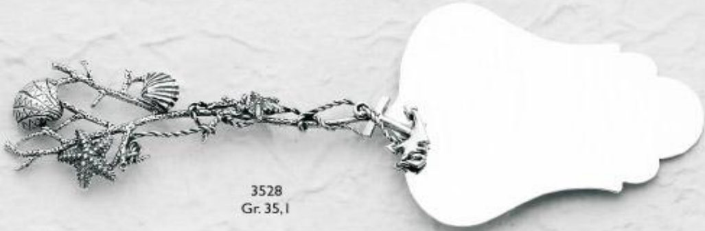
3528 Gr. 35,1