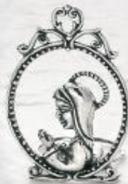
3280 Gr. 10,3