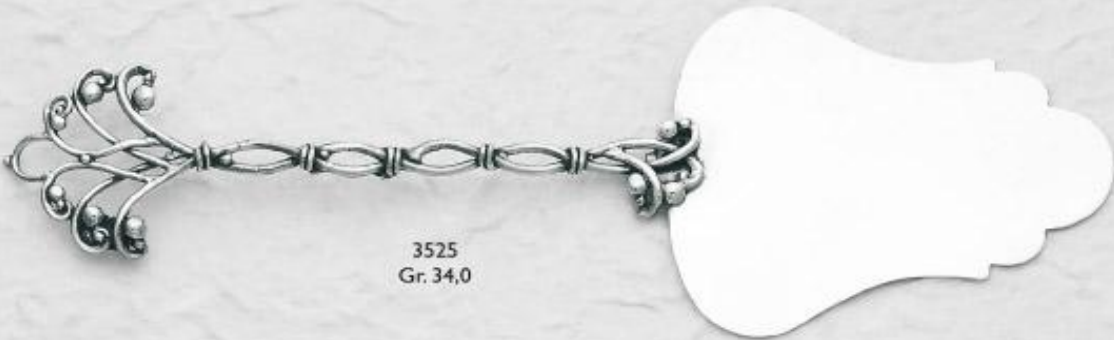
3525 Gr. 34,0