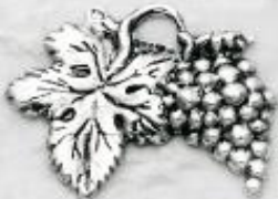
3347 Gr. 5,4