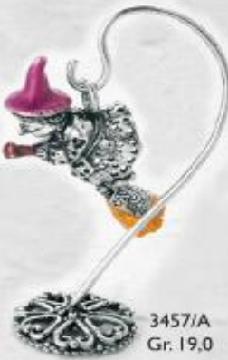
3457/A Gr. 19,0