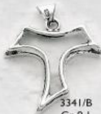
3341/B Gr. 9,1