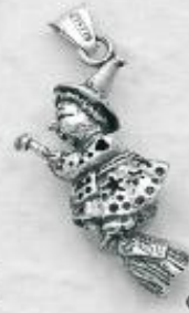
3479 Gr. 12,2