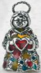
3382/A Gr. 12,4