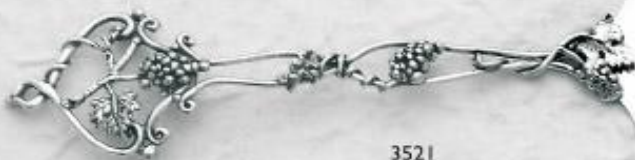
3521 Gr. 28,5