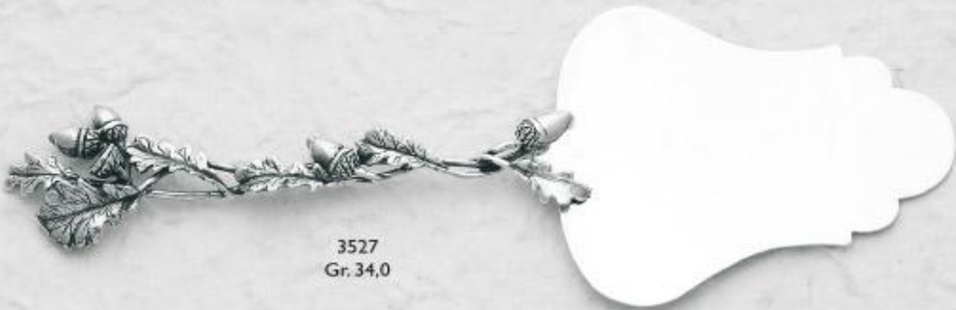
3527 Gr. 34,0