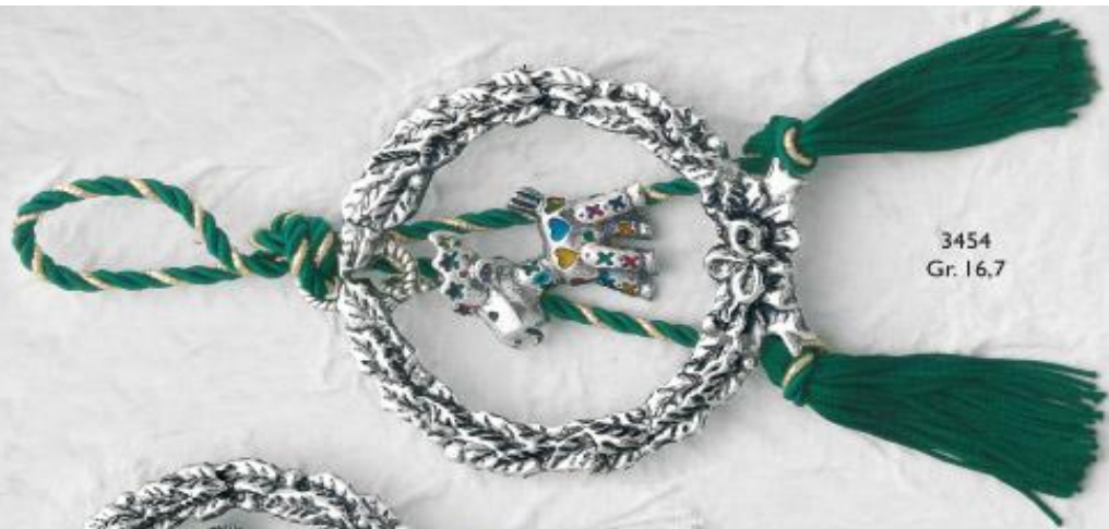
3454 Gr. 16,7