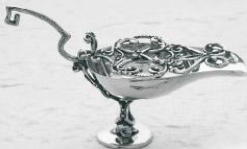
3209 Gr. 21,8