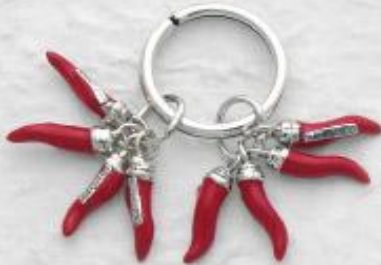
P3207/A Gr. 21,5