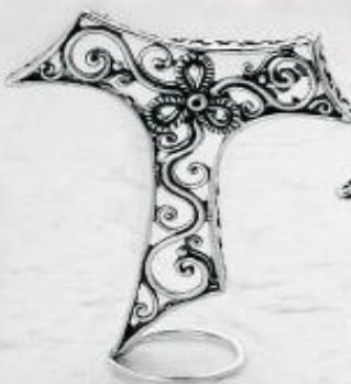
3344 Gr. 14,4