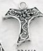
3346/A Gr. 4,5