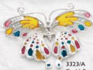
3323/A Gr. 11,5