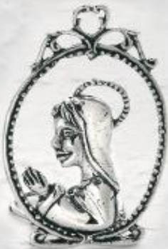
3281 Gr. 24,3