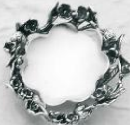
3548 Gr. 13,0