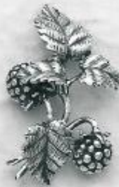
3531 Gr. 17,4