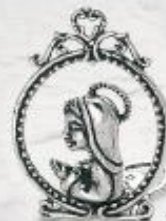
3279 Gr. 9,0