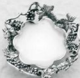
3551 Gr. 13,0