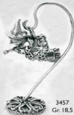
3457 Gr. 18,5