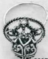
3337 Gr. 9,1