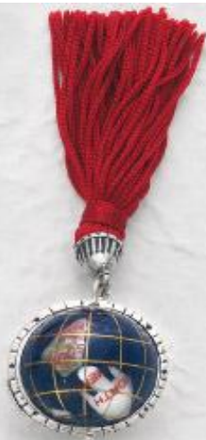
3261 Gr. 20,0