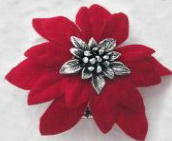
3405 Gr. 9,1