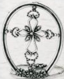
3266 Gr. 10,5