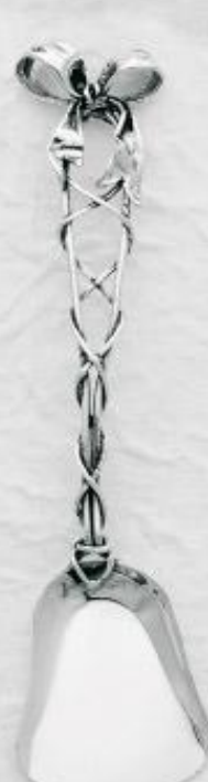
3148 Gr. 14,0