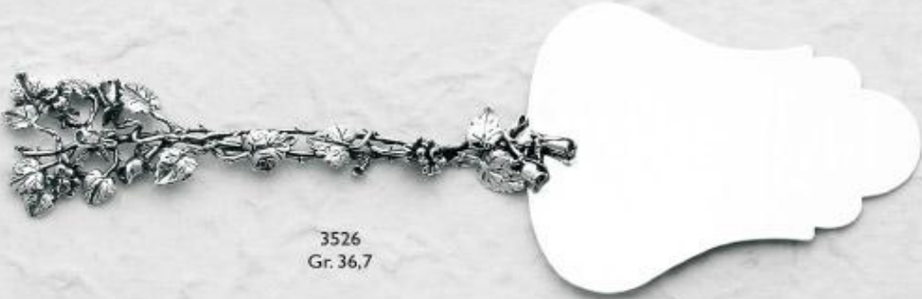
3526 Gr. 36,7