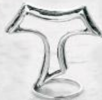
3341 Gr. 9,6