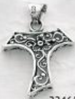
3346/B Gr. 5,1