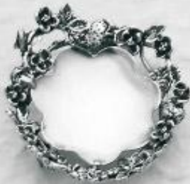
3549 Gr. 13,0