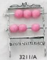
3211/A Gr. 6,5