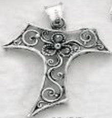
3345/B Gr. 7,3