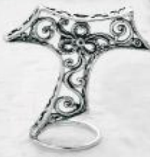
3345 Gr. 7,9