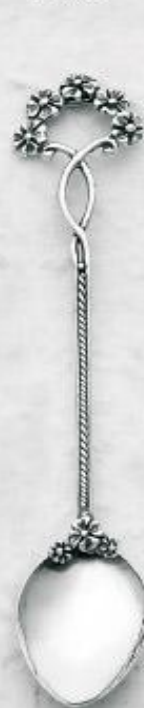
3545 Gr. 10,2