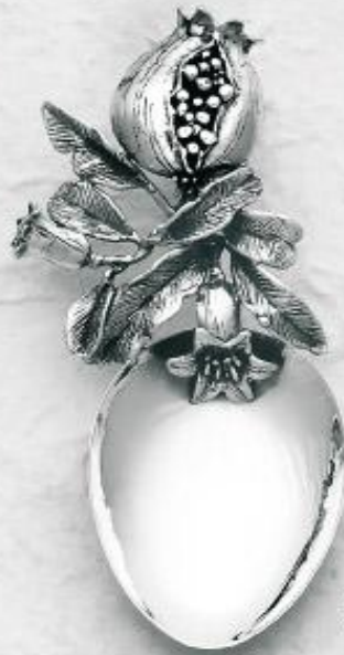
2742/A Gr. 32,1