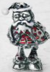
3481/A Gr. 19,2