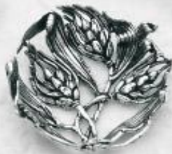
3547 Gr. 10,4