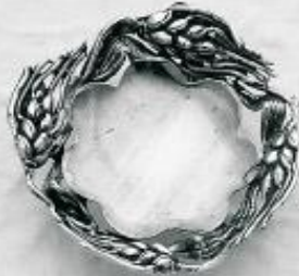
3554 Gr. 13,0