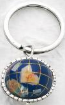
P3261 Gr. 25,5