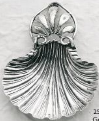
2524/A Gr. 14,4