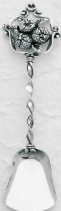
3155 Gr. 18,3