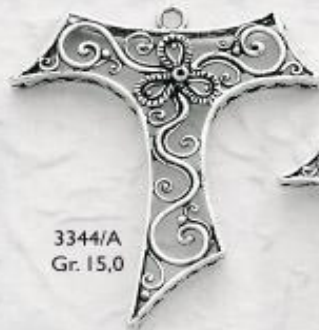
3344/A Gr. 15,0