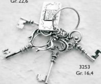
3253 Gr. 16,4