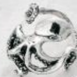
3288 Gr. 9,1