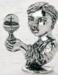
3158/A Gr. 15,4