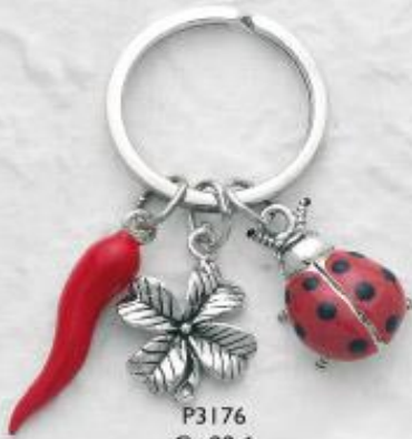
P3176 Gr. 22,6