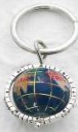
P3260 Gr. 16,0