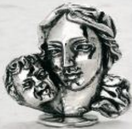
3131/A Gr. 19,2