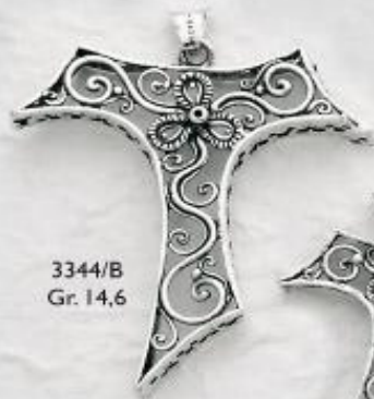
3344/B Gr. 14,6