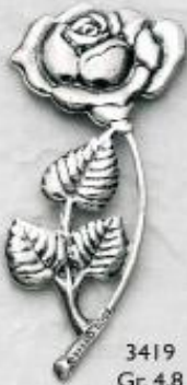
3419 Gr. 4,8