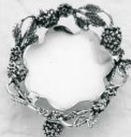
3550 Gr. 13,0