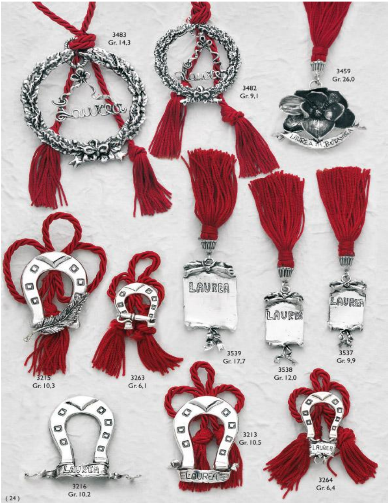
3483 Gr. 14,3