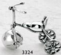
3324 Gr. 12,5