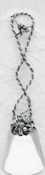
3145 Gr. 12,5