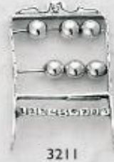
3211 Gr. 7,6