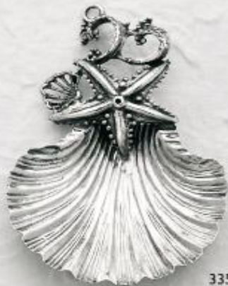
3352 Gr. 18,5