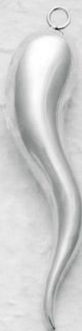
3484 Gr. 21,1