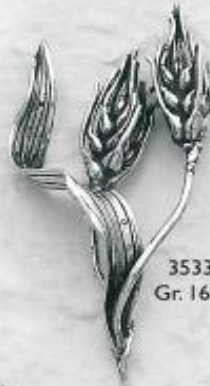
3533 Gr. 16,7