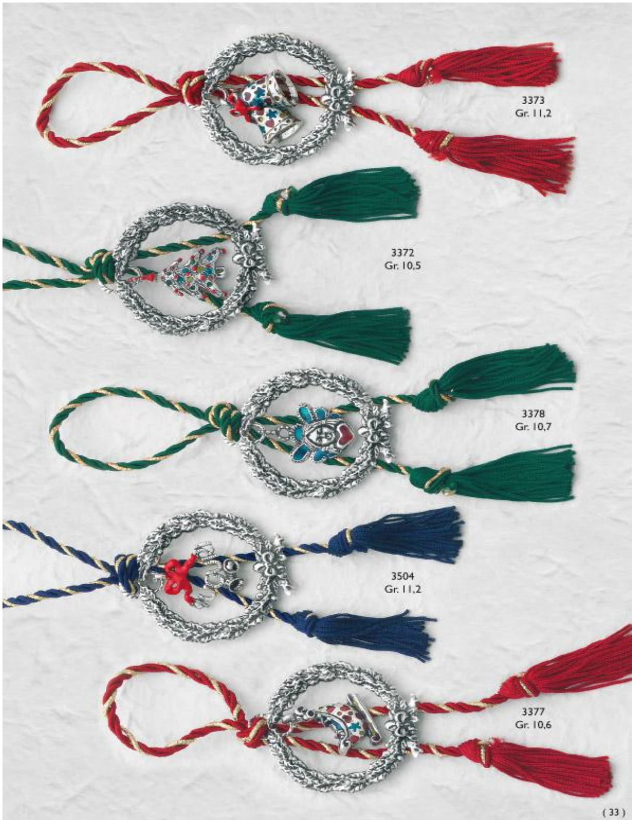
3373 Gr. 11,2