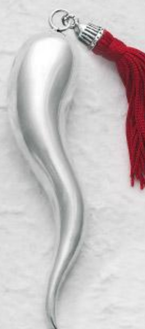
3484/A Gr. 24,0