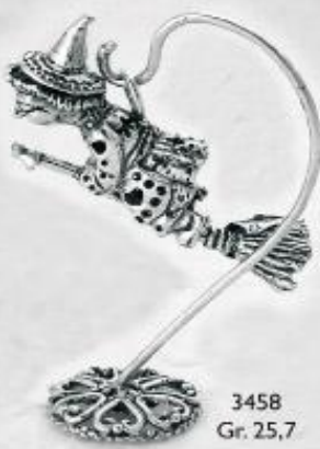
3458 Gr. 25,7