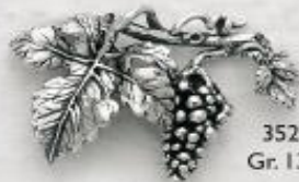
3529 Gr. 13,2