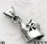
3327/B Gr. 4,3