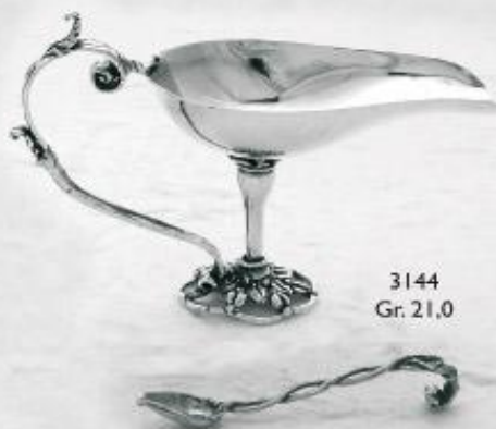
3144 Gr. 21,0