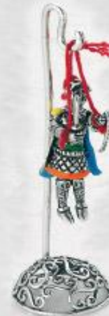
3008 Gr. 16,7