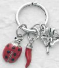
P3177 Gr. 14,1