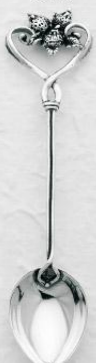
3156 Gr. 14,5