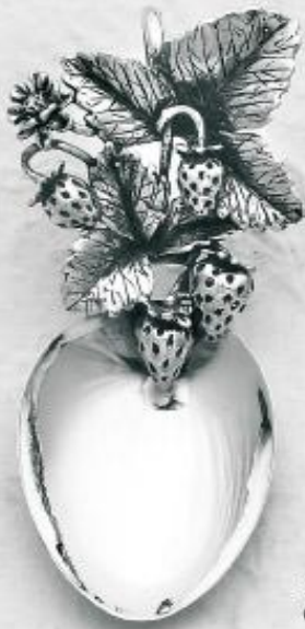
2743/A Gr. 30,3