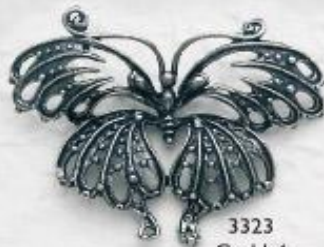
3323 Gr. 11,4