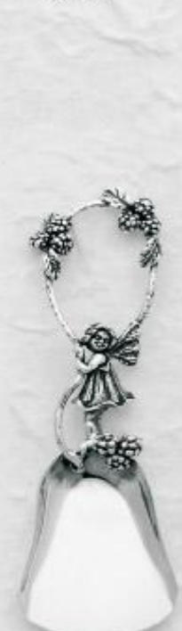
3173 Gr. 13,3