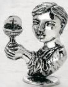
3151/A Gr. 24,2