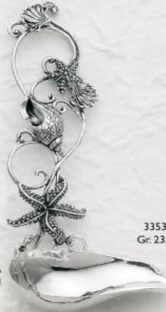
3353 Gr. 23,5