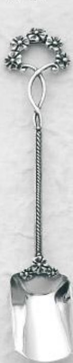
3545/A Gr. 11,2