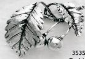
3535 Gr. 14,0