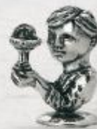
3152/A Gr. 9,5