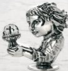
3160/A Gr. 14,0