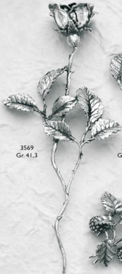
3569 Gr. 41,3