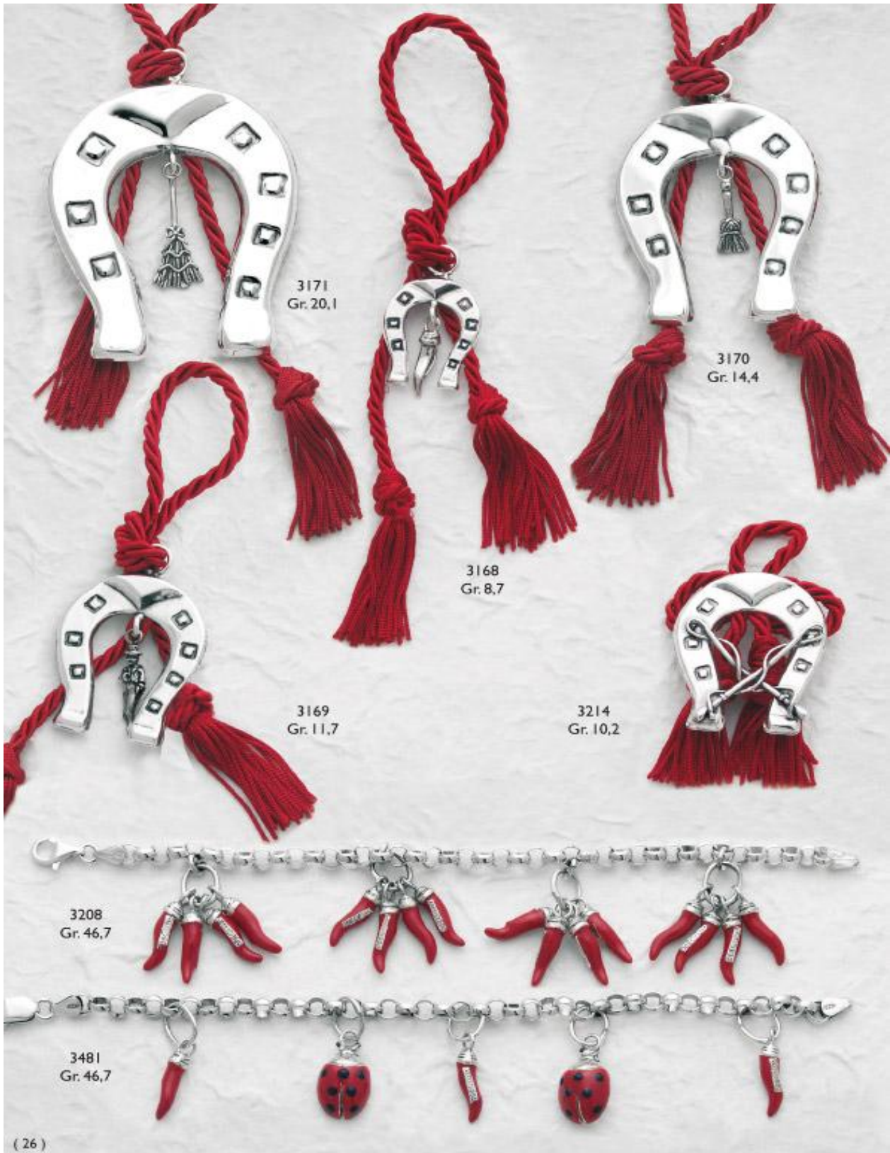
3171 Gr. 20,1