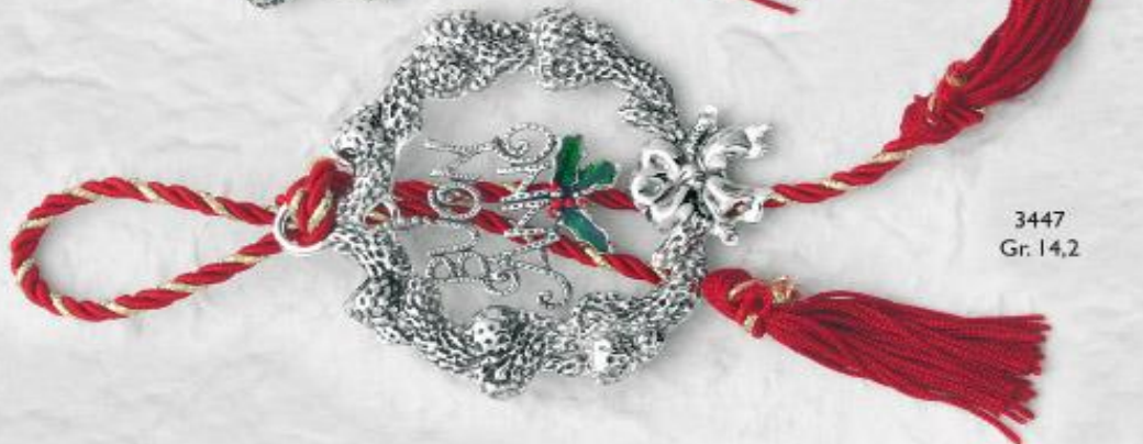
3447 Gr. 14,2