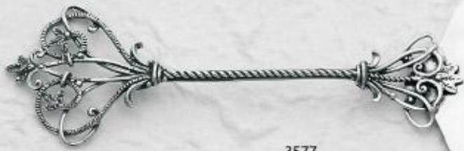
3577 Gr. 27,5