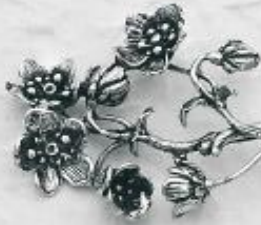
3576 Gr. 39,9