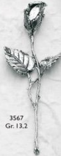
3567 Gr. 13,2