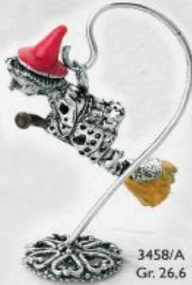
3458/A Gr. 26,6