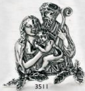
3511 Gr. 10,5