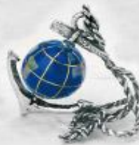
3258 Gr. 9,5