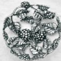
3541 Gr. 14,8