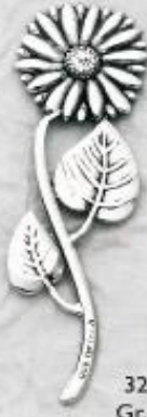
3206 Gr. 4,6