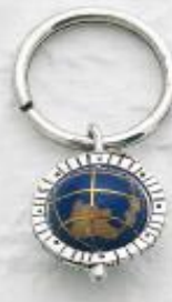
P3259 Gr. 12,2