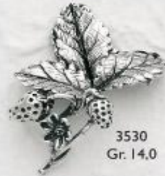
3530 Gr. 14,0