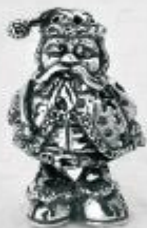
3381 Gr. 19,2