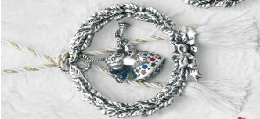
3452 Gr. 18,0