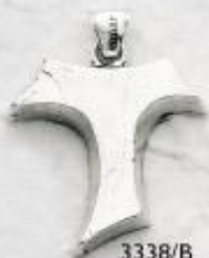
3338/B Gr. 9,7