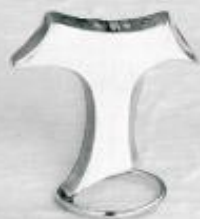
3338 Gr. 8,3