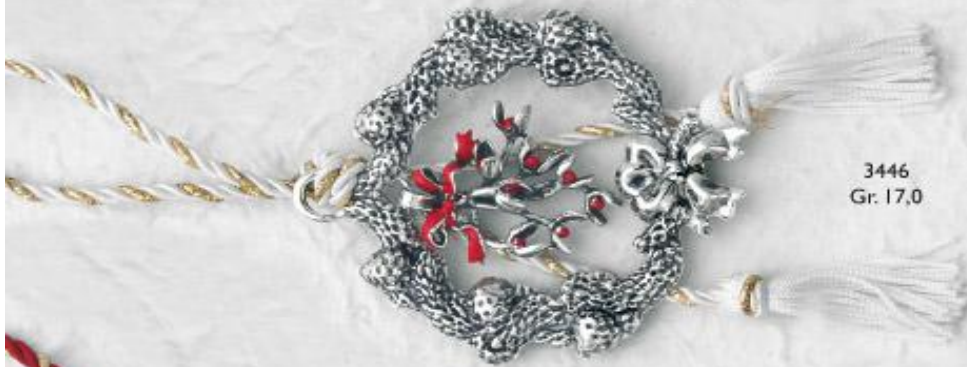
3446 Gr. 17,0