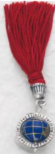
3259 Gr. 10,7