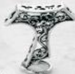
3346 Gr. 5,2