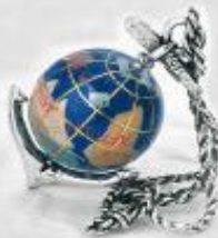
3257 Gr. 13,4