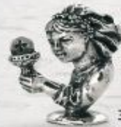
3159/A Gr. 11,0