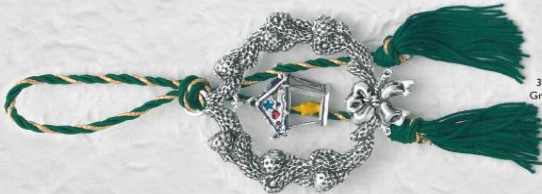
3371 Gr. 14,0