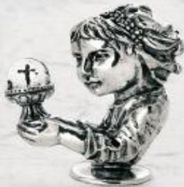
3187/A Gr. 20,0