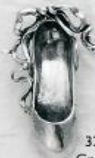
3265 Gr. 11,0