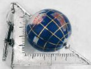
3212 Gr. 19,0