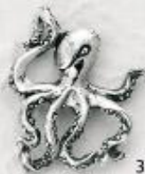
3289 Gr. 8,9