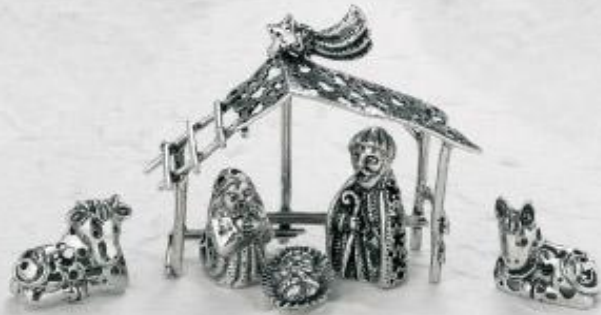
3415 Gr. 52,0