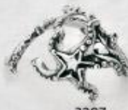
3287 Gr. 7,7