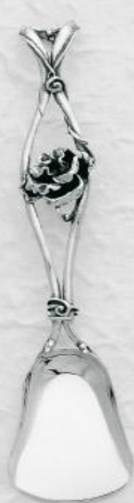
3147 Gr. 17,5