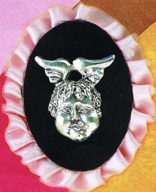
1530-A Gr 15,0