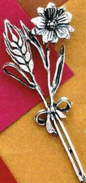
1358 Gr 8,5