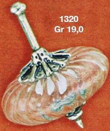
1320 Gr 19,0