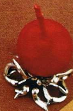
1518 Gr 6,2