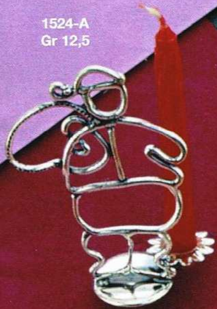
1524-A Gr 12,5