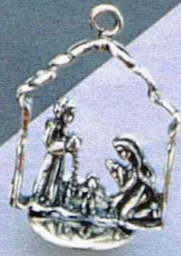
1466 Gr 11,6