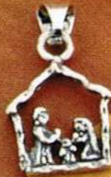
1441-A Gr 4,6