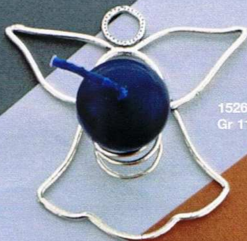
1526-B Gr 11,8