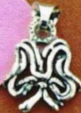
1493 Gr 3,2