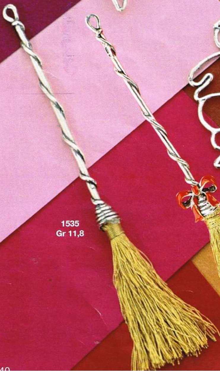
1535 Gr 11,8