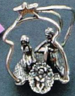
1529 Gr 14,6