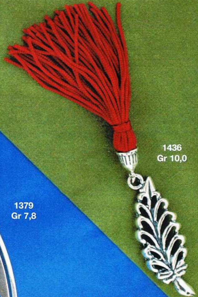
1436 Gr 10,0