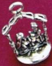
1441 Gr 5,0