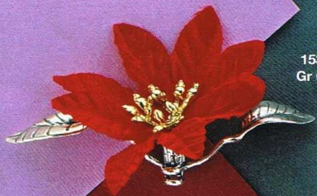
1534 Gr 6,8