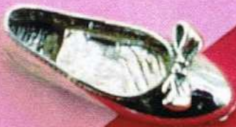
1381 Gr 10,8