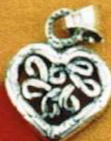
1496 Gr 3,0