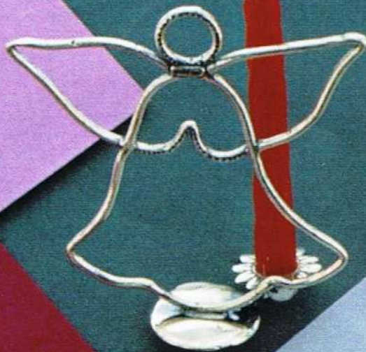
1526-A Gr 12,0