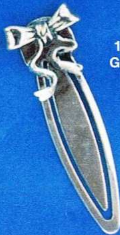
1379 Gr 7,8