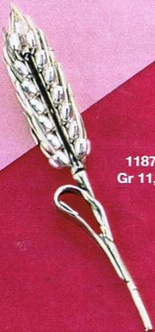
1187 Gr 11,4