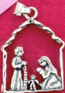
1466-A Gr 10,0