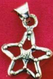
1489 Gr 3,0