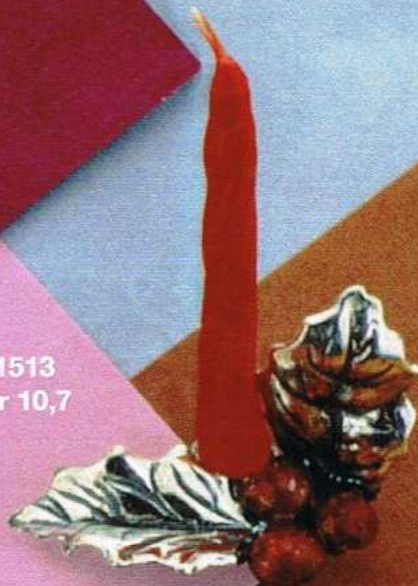
1513 Gr 10,7