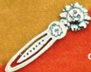
1522 Gr 2,7