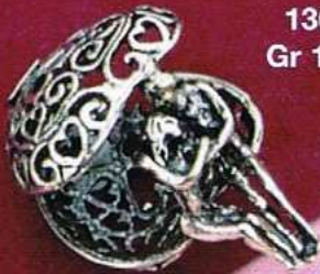
1361 Gr 12,3