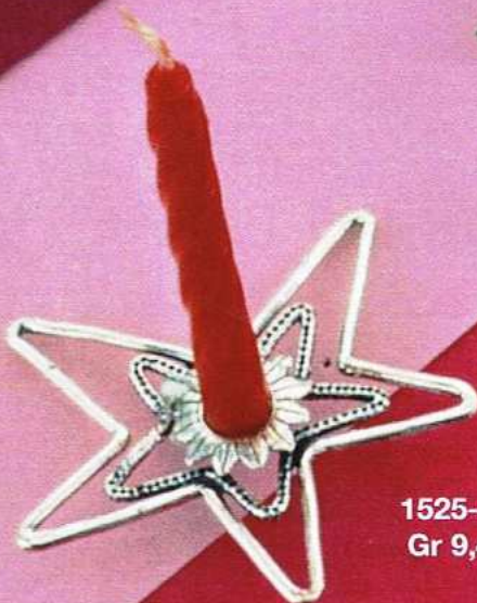
1525-A Gr 9,4