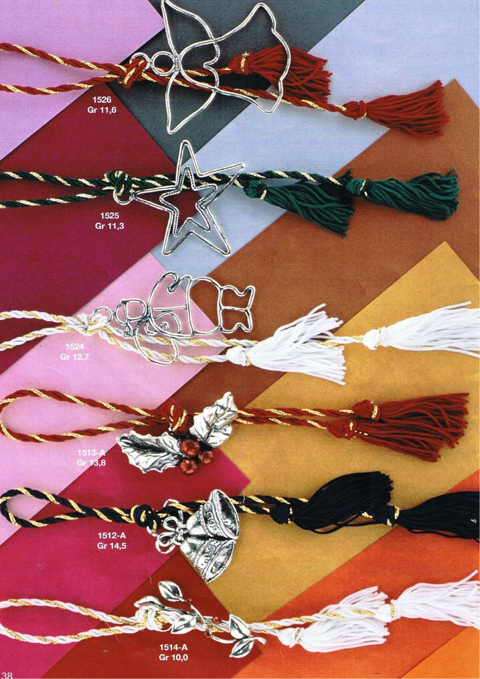
1526 Gr 11,6