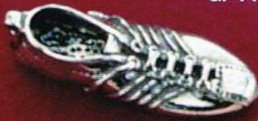
1364 Gr 14,0