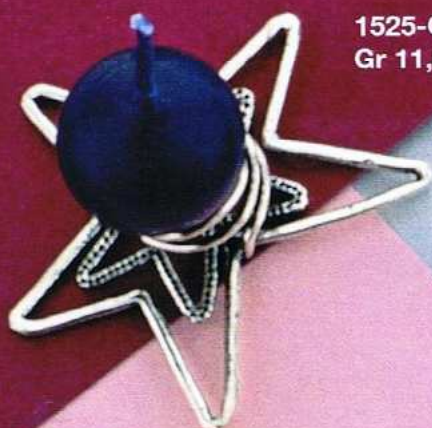
1525-C Gr 11,0