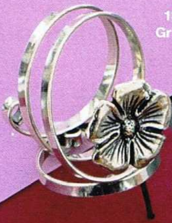
1359 Gr 21,5