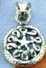
1492 Gr 3,3