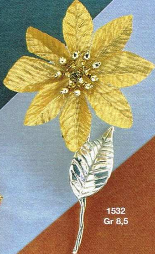
1532 Gr 8,5