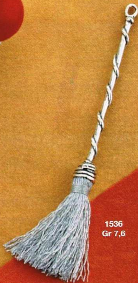
1536 Gr 7,6