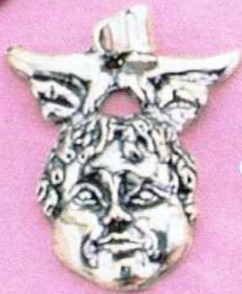
1530 Gr 9,8