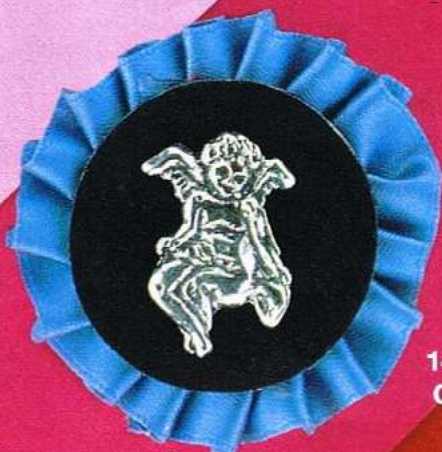
1486-A Gr 6,8