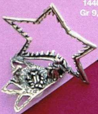
1440 Gr 9,5