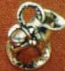
1494 Gr 3,4