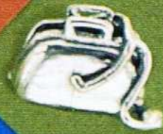
1420 Gr 8,8