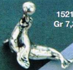
1521 Gr 7,3