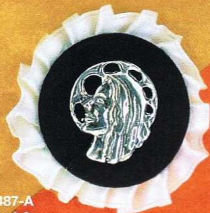
1487-A Gr 6,9