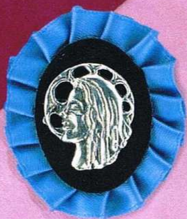
1487 Gr 5,8