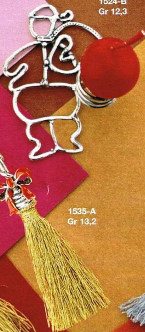
1524-B Gr 12,3