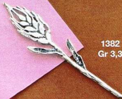
1382 Gr 3,3