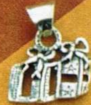
1495 Gr 3,4