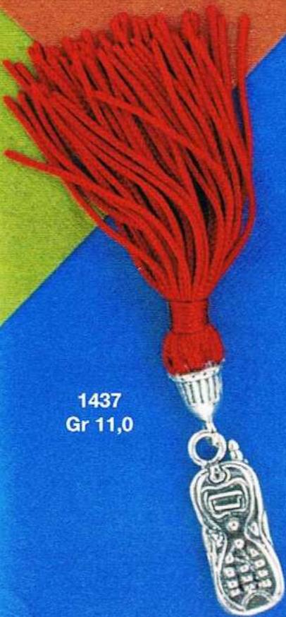
1437 Gr 11,0