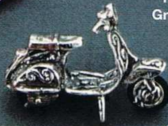
1438 Gr 11,8