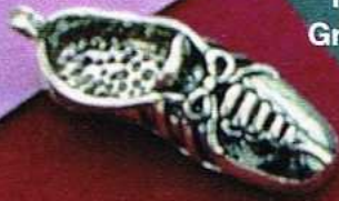
1419 Gr 13,2