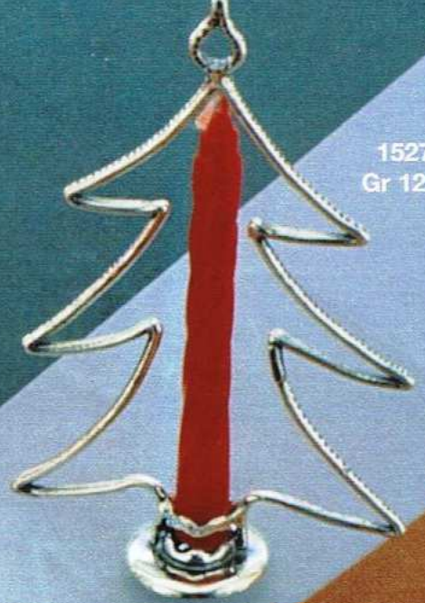
1527 Gr 12,0