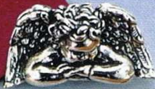
1380 Gr 15,7