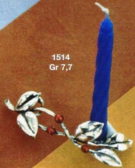
1514 Gr 7,7