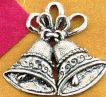
1512 Gr 11,0