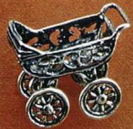
1347 Gr 11,0