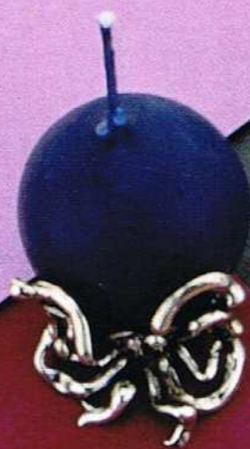
1519 Gr 8,7