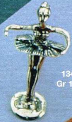
1344 Gr 10,8