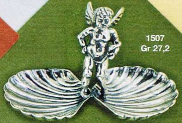
1507 Gr 27,2