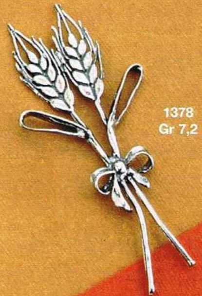
1378 Gr 7,2