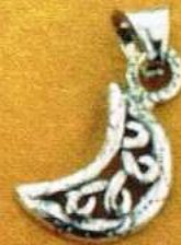
1490 Gr 2,6